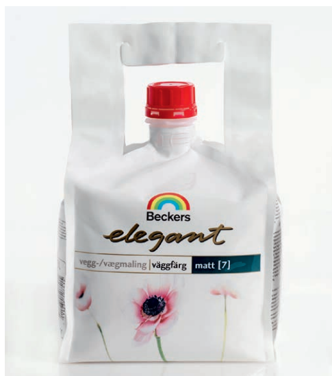
Beckers: erste internationale Anwendung Non-Food

als erste Food-Anwendung werden Senf, Mayonnaise und Ketchup von Hugo Reitzel zukünftig in BRAINYPACK®s präsentiert. Hierzu wurde von Hugo Reitzel eigens ein Abfüllständer entwickelt, an welchem der Beutel mit Verschluss nach unten und einem speziellen Adapter zur Portionierung fixiert werden kann – die ideale Lösung für die Gastronomie. Der BRAINYPACK® erfüllt die Bedürfnisse der Kunden im B2B-Bereich genauso wie diejenigen der Endkunden. ■