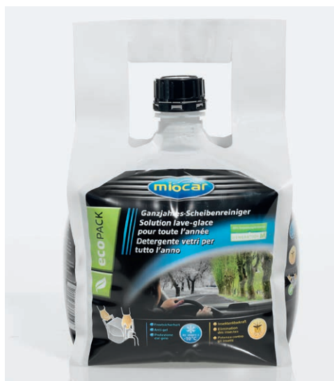
miocar: erste nationale Anwendung Non-Food